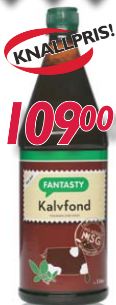
047460 Kalvefond Fantasty flytende 1 ltr.