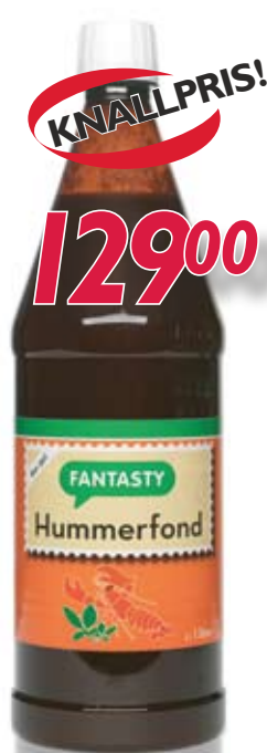
047545 Hummerfond Fantasty flytende 1 ltr.

Barbeque-sauser til marinade, dipp, grillsaus.