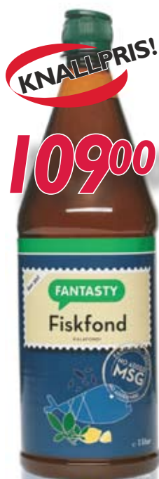
047462 Kyllingfond Fantasty flytende 1 ltr.