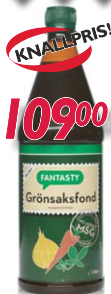
047463 Grønnsakfond Fantasty flytende 1 ltr.