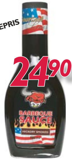
047495 Barbecue saus Hickory 500ml flaske