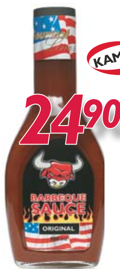
047494 Barbecue saus Original 500ml flaske

Barbeque-sauser til marinade, dipp, grillsaus.