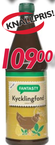
047512 Fiskefond Fantasty flytende 1 ltr.