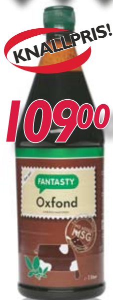
047461 Oksefond Fantasty flytende 1 ltr.